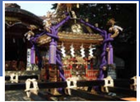
▶新調された宮神輿

東急大井町線荏原町駅の近くに 14 年後に神社鎮座 1000 年を迎える旗岡八幡神社があります。荏原・中延・旗の台地域の氏神様として親しまれてきました。