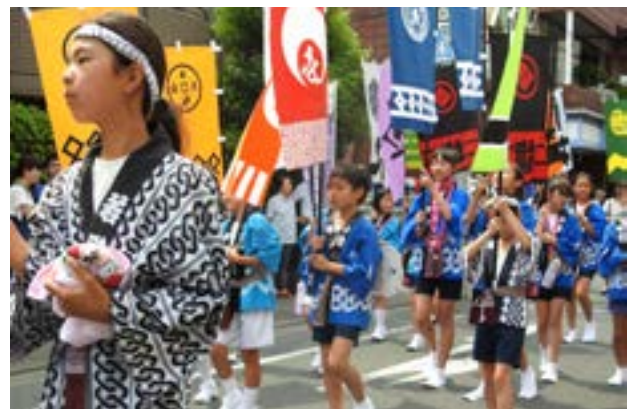
▲各町会の短幟を持つ子どもたち