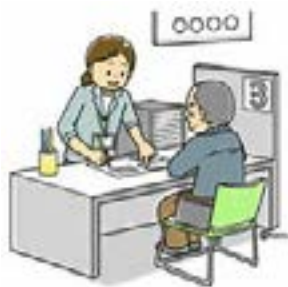
取材：長谷部博昭 (支部理事) 撮影：神田敦子 (支部理事)

秋本 そうですね、お互いにお互いを知るという意味でもしっかり連携をとっていき、気軽に相談できるような関係を築いていきましょう。