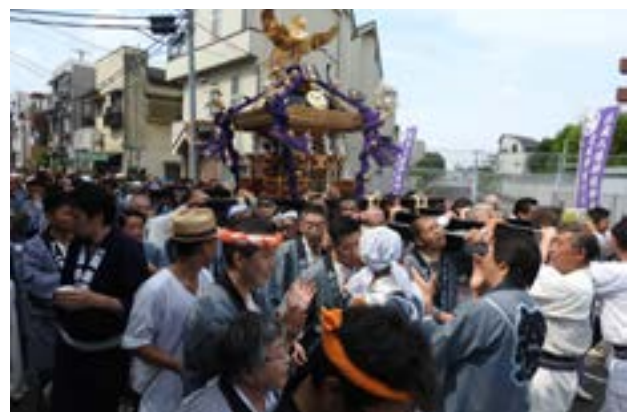
▲地域の津々浦々を宮神輿が行く

地域の祭礼に町会が協力することは憲法上問題ではないかとお考えになる方もおられるかもしれませんが、地域の祭礼には宗教的意味合いは薄く、地域の親睦の場となっている場合が多く、最高裁の「行為の目的が宗教的意義を持ち、その効果が宗教に対する援助、助長、促進又は圧迫、干渉等になるような行為」に照らしても宗教的活動に当たらないと思います。