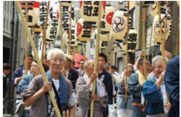
▲各町会の高張提灯